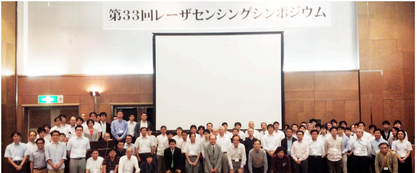
第33回レーザセンシングシンポジウム参加者

技術分野の専門家に加え、大気・海洋・気象・環境科学関係の研究者が集い、情報交換を行う場として、重要な役割を担っていると思います。今回のシンポジウムで試行した取組については、レーザ・レーダ研究会の活性化委員会が、参加者にもアンケート調査を行い、引き続き参加者が増え参加者の満足度を高める取組を検討しています。