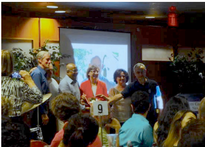
バンケットの様子

学会 3 日目の午後は、学会主催のツアーとバンケットが開催された。ツアーはマンハッタン島を 1 周するクルーズであったが、通常のクルーズツアーに現地集合で乗り込むという学会色の少ないものであった。ツアーが終わると各自、バンケット会場の大学まで公共交通機関で移動した。料理は美味しく、功績賞の表彰などが行われた。