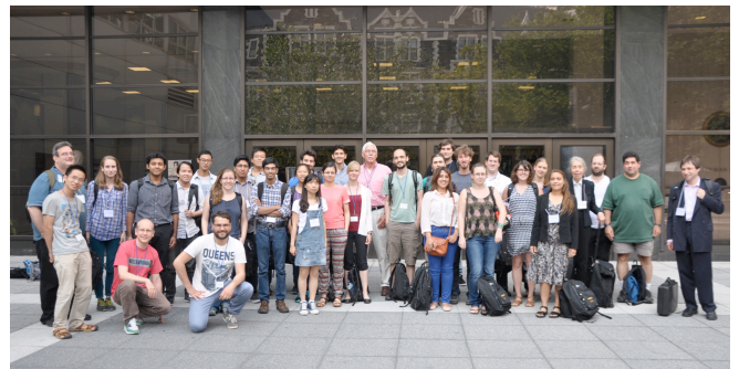
Summer-school participants

developing a field deployable diode laser based water vapor DIAL for heavy rain prediction during the summer season in urban areas of Japan. We also applied modulated pulse technique to improve the system performance. In this poster, we showed the observational testing result in June 22, 2015. During one and half hour of poster session, I had described the background of this lidar system as well as observational result discussions and comparisons. The audiences were interested in the compact, deployable, eye-safety, low-cost, low power diode laser DIAL. They were also impressed by the agreement of the observational water vapor density compared to the radiosonde data. However, they also gave some comments for improving the system.