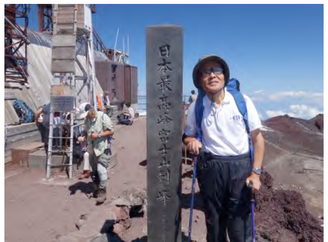
富士山頂にライダー設置の調査登山（2015年8月）

「環境変化への対応が遅れた組織は滅亡する」という自然の基本法則の存在を生物や人類進化の歴史が教えてくれています。本研究会もしばらくは活性化に汗を流す期間が必要でしょう。しかし、やがて我が国の若手研究者や技術者から世界に誇れる大きな成果が輩出して、地球温暖化や大気汚染問題の改善策の科学的検証や異常気象の高度情報化策の推進や、さらにはフォトニクス産業の発展にも大きく寄与するだろうとの「物語り」を夢見ている昨今です。