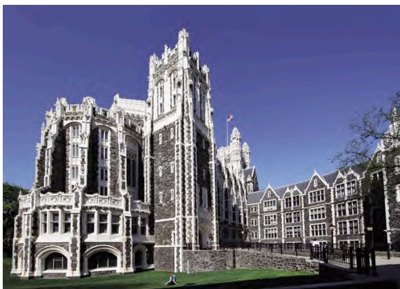
会場外観