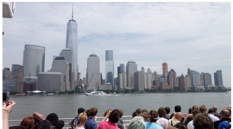
エクスカージョン