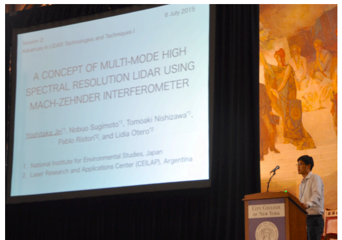
口頭発表の様子

Advance in LIDAR Technologies and Techniques I セッションにおいて、マルチモードレーザーを用いた新しい高スペクトル分解ライダーの概念に関する口頭発表を行った。この研究の目的は、夜間のラマンライダーよりも高感度で昼夜大気エアロゾルの消散係数を連続的に測定可能な、安価で簡易な高スペクトル分解ライダーを開発することにある。本発表では、レーザーの縦モード間隔と同じスペクトル間隔を持つマツハツェンダー干渉計を用いた手法の概念を報告した。干渉計をレーザーのモード間隔分だけスキャンすることによって、ミー散乱とレイリー散乱成分を分離する。この時、送信レーザー光の一部をリファレンス信号として、レーザーのスペクトル幅に起因するバイアス等を評価する。