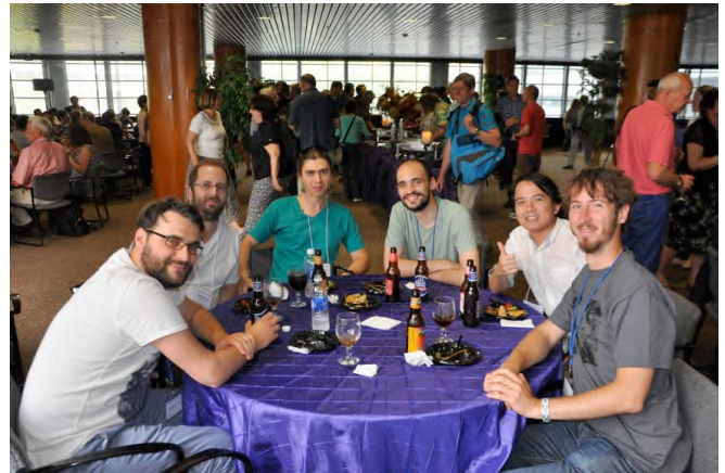
At reception (Photo taken from ILRC27 www site).