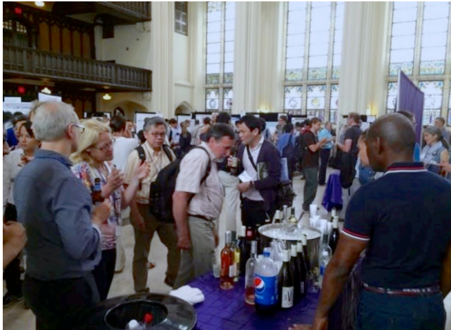
ポスター発表の様子

い発表が多かった。また、Licel 社等の 6 つの企業の展示が別の部屋で開催されており、ライダー観測で実際に使用されている機器の説明を受けることができる。