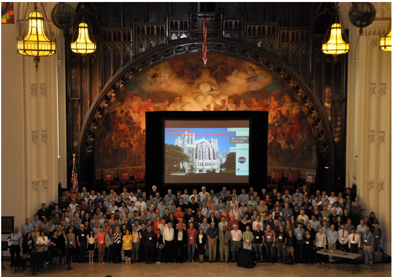
第 27 回レーザーダ国際会議参加者

境界層の観測では、気温や水蒸気の詳細なプロファイルの測定に関する Behrendt ら (Hohenheim 大学) などのいくつかの報告が印象に残った。